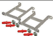
H-HW 160 code 850 101

Für / For / Pour / Per: HV 60/125, HV 60/125 SG, HV 70/125, HW 60/125 HWK 60, HW 60, HW 60/250