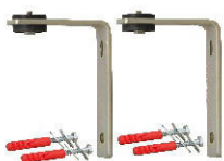
L-HV 100-150 code 840 009